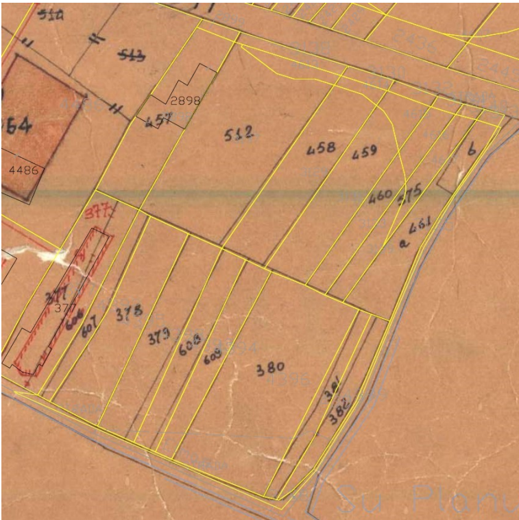
Sovrapposizione mappa di impianto e mappa catastale attuale

C_I580 - C_I580 - 1 - 2024-02-23 - 0009063